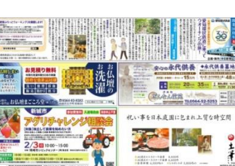
▲2018年1月26日付 中日新聞朝刊 西三河版・近郊通し版見開き30段