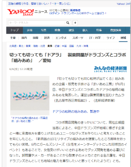
↑6月6日 Yahoo!ニュース画面