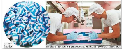
↑6月21日付 中日新聞夕刊