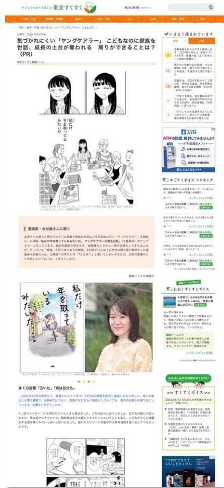
インタビュー記事の例 (子ども家庭庁様)