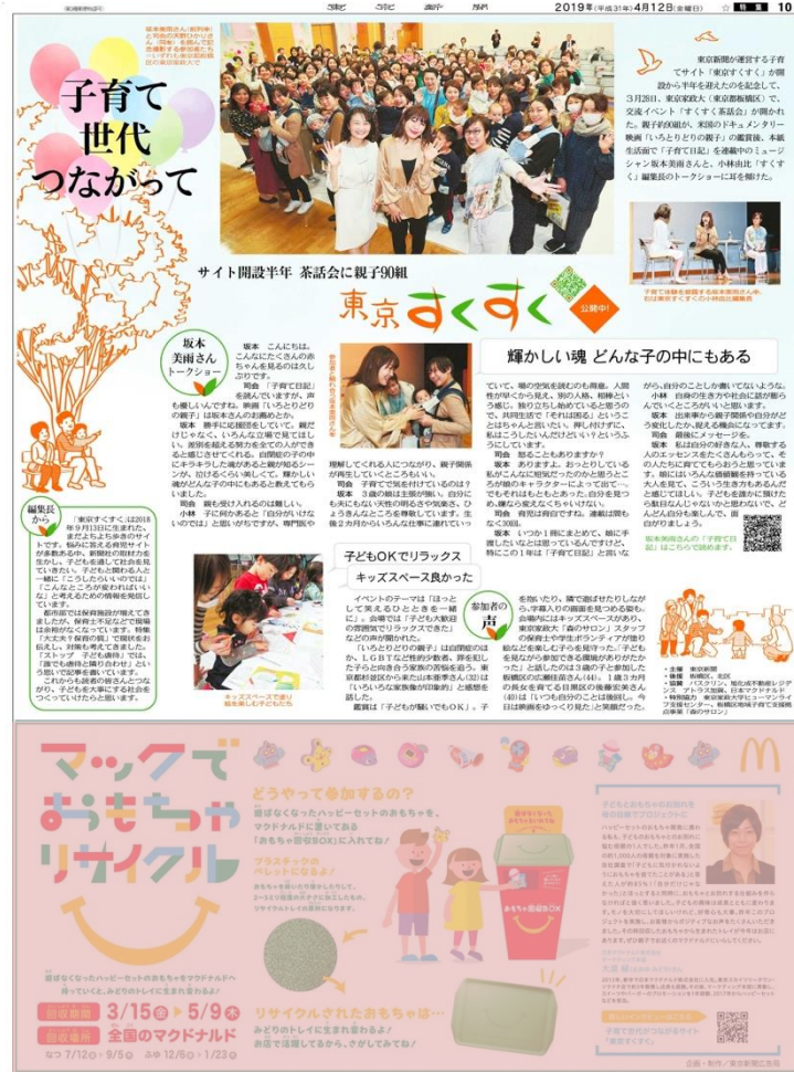
2019年4月12日付東京新聞朝刊「すくすく茶話会」 ※記事掲載の事例でありサイズは異なる可能性があります