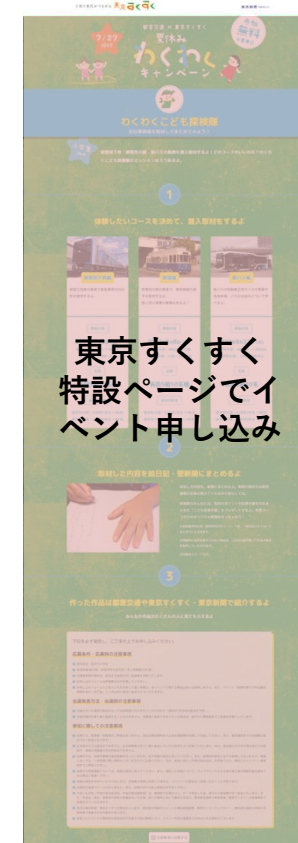
※告知広告・特設ページ などはイメージです