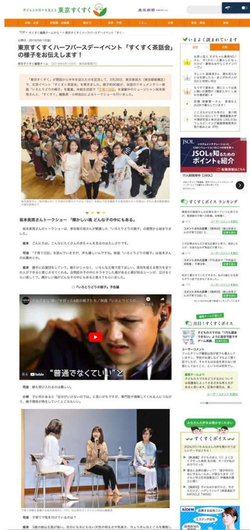
「すくすく茶話会」 載録記事

東京新聞朝刊で掲載したレポート記事と同じ内容の記事を、東京すくすく（WEB）で掲載します。 子育て世代が集まるサイトで伝えることで、長く読まれる記事となります。