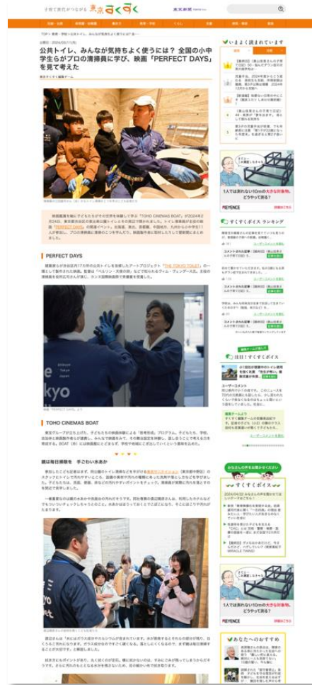
イベント体験レポートの例 (TOHO シネマズ様)

子育て情報サイト「東京すくすく」にて、 貴社の取り組みをタイアップ記事（広告）として取材・掲載 いたします。本企画にご協賛いただいた意図や子ども・子育て世代への貢献、子ども真ん中社会への取り組みなどを取材・掲載いたします。子育て中の方だけでなく子ども関連の仕事や取り組みをされている方などに広く読まれているサイトです。