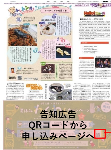
新聞5段カラーにて告知 (複数回掲載)