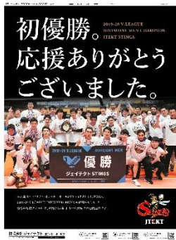
中日スポーツ 2020年3月31日掲載