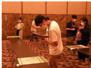
<読者による審査会> 6月27日東京 7月4日名古屋で実施