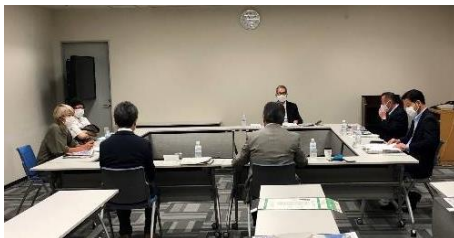
<専門家審査会> 7月18日東京で実施