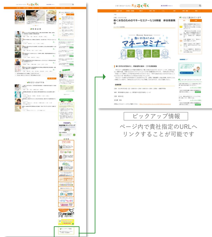
サイト右メニューに表示