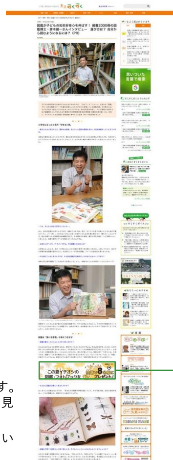
タイアップページ