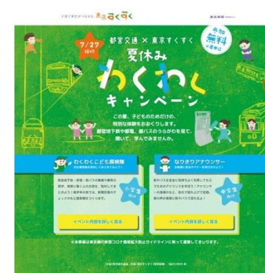
キャンペーンページ