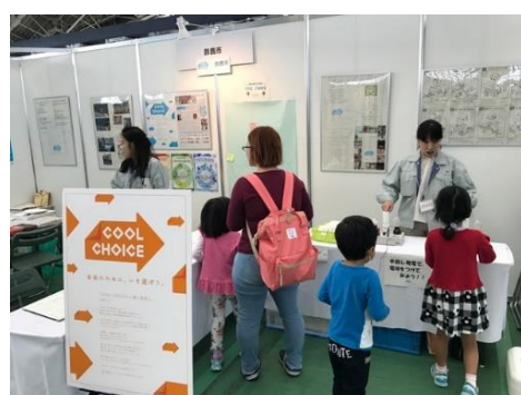
「住まいと暮らしの総合フェア」ブース